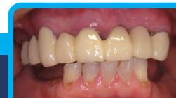
口腔内にセットした状態

Ⓑ単根の前歯を連結固定することで前歯の複根化をはかる。2本以上の上顎前歯を前装冠で連結固定することにより、下顎前歯からの力に対し、強度を持たせる。